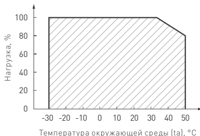
Рис. 2. Максимальная допустимая нагрузка, % от мощности источника.