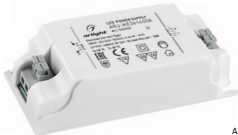
ARJ-KE521050 ARJ-KE421400 ARJ-KE361400A